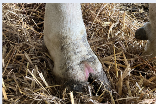
Hollt y carn yn goch