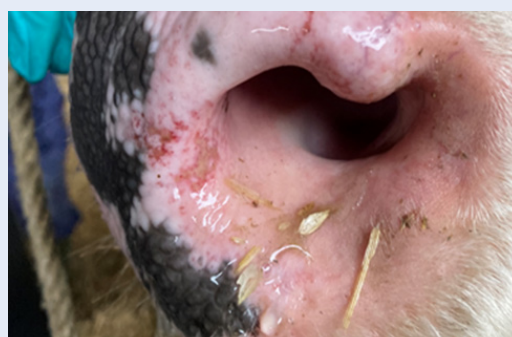
Briwiau yn y ffroenau